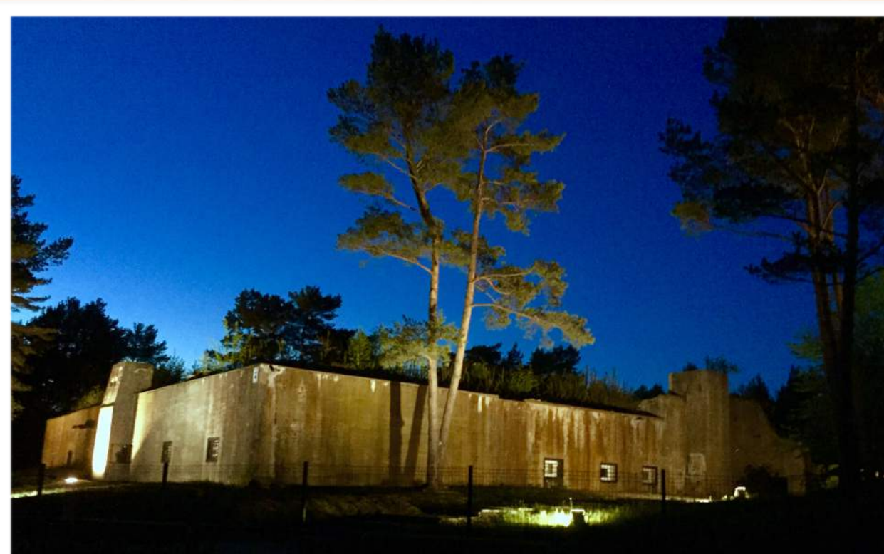
Inaczej wyglądają zabytkowe mury podświetlone nocą.